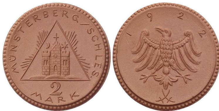
2 marki 1922 biskwit Ø31 mm, nakład 5500 egz.

Za wzór dla motywów zamieszczonych na rewersie monet 1 i 2-markowych posłużyły średniowieczne wizerunki pieczęci miejskich Ziębic, tj. z okresu, kiedy miasto przeżywało chwile swojej chwały i rozkwitu, początkowo w granicach księstwa wrocławskiego, a następnie jako stolica piastowskiego księstwa utworzonego w związku z podziałem dzielnicowym księstwa wrocławskiego, dokonanym po śmierci Henryka IV Probusa w 1290 r. Ziębice znalazły się wówczas w granicach księstwa świdnickiego, rządzonego przez Bolka I Surowego. Po śmierci Bolka w 1301 roku, księstwo świdnickie przypadło w udziale jego nieletnim synom: Bernardowi, Henrykowi i Bolkowi. W 1322 r. najmłodszy syn Bolko otrzymał we władanie wschodnią część księstwa z Ziębicami i Ząbkowicami, obierając Ziębice za swoją siedzibę i przybierając imię Bolka II.