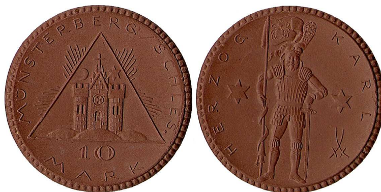
10 marek b.d. (1922) biskwit Ø42 mm, nakład 5400 egz.

Na rewersie monety 10-markowej widnieje stojąca postać księcia Karola I Podiebradowicza w zbroi, z kopią i mieczem, po jego bokach gwiazdy oraz w otoku napis HERZOG / KARL. Z prawej strony znak Staatliche Porzellan Manufaktur Meissen.