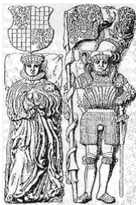
Nagrobek Karola I Podiebradowicza i Anny Żagańskiej w kościele parafialnym św. Anny w Ząbkowicach Śląskich

Karol I Podiebradowicz urodził się w roku 1476. W latach 1498-1536 ksiązę ziebicki, w latach 1498-1500 hrabia kłodzki (tytularnie do śmierci), w latach 1495-1536 ksiązę oleśnicki. W roku 1515 król Władysław Jagiellończyk mianował Karola swoim doradcą. W 1517 r. Karol I zostaje starostą generalnym Dolnego Śląska i dożywotnim starostą księstwa głogowskiego, w 1519 r. został zwierzchnim wójtem Górnych Łużyc, w 1523 r. namiestnikiem Królestwa Czeskiego, a w 1528 r. został mianowany przez cesarza Ferdynanda I starostą Dolnego i Górnego Śląska. Karol I zmarł 31 maja 1536 r. w Ząbkowicach Śląskich i został pochowany w kościele parafialnym św. Anny, gdzie znajduje się nagrobek księcia oraz jego żony Anny. Tak jak i w przypadku monety 5-markowej, przedstawiony na tym nagrobku wizerunek Karola posłużył za wzór dla rewersu monety 10-markowej.