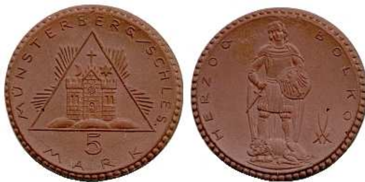
5 marek b.d. (1922) biskwit Ø37mm, nakład 5000 egz.

Bolko (Bolesław) II Ziębicki urodził się ok. 1300 r. Książę świdnicko-ziębicki w latach 1312-1322, książę ziębicki od 1322. Panowanie Bolka II charakteryzuje sukcesywny opór przed złożeniem hołdu lennego na rzecz Czech, w wyniku czego w roku 1335 jego księstwo zostało zaatakowane przez Karola Luksemburczyka. Pomimo zwycięstwa, w roku 1336 książę dobrowolnie uznał się lennikiem władcy czeskiego. Prawdopodobną przyczyną takiej decyzji była rezygnacja z księstw śląskich przez króla Polski Kazimierza Wielkiego, co spowodowało, że książę stracił nadzieję na skuteczne opieranie się potędze czeskiej. Ważną przyczyną takiej decyzji było też przekazanie Bolkowi II w dożywotnie władanie ziemi kłodzkiej. W akcie lennym Bolko zobowiązał się, że po wymarciu jego potomków księstwo ziębickie przejdzie pod bezpośrednie panowanie króla Czech. Bolko II Ziębicki zmarł w stolicy swojego księstwa 11 czerwca 1341 r. i został pochowany w klasztorze w Henrykowie, gdzie zachował się nagrobek księcia oraz jego żony Guty (Jutty ?). Jego wizerunek przedstawiony na tym nagrobku posłużył jako wzór dla monety o nominale 5 marek.