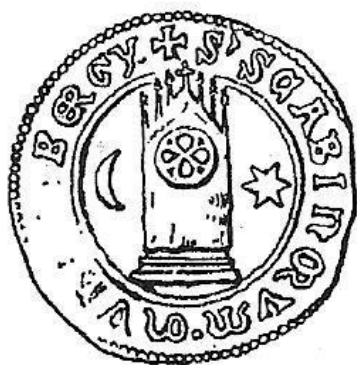
Pieczęć miejska Ziębic z roku 1366 według ryciny Franza Hartmanna (1907 r.)

Wzorem dla rewersu monety 1-markowej była pieczęć miejska Ziębic z roku 1366, natomiast wzór dla rewersu monety o nominale 2-ch marek stanowiła pieczęć miejska z roku 1292.