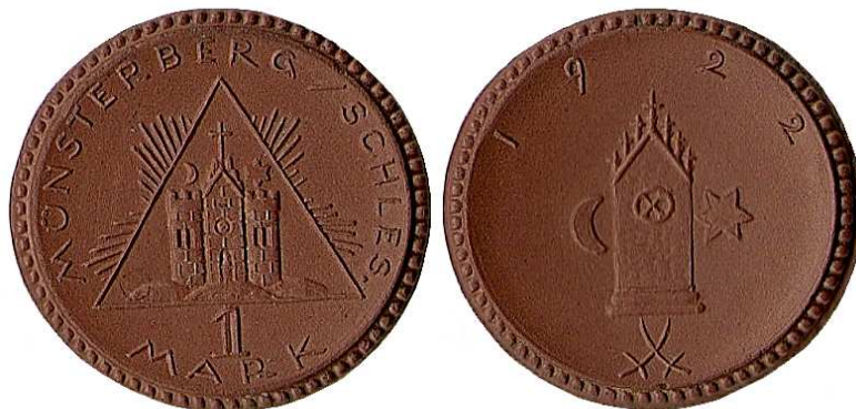
1 marka 1922 biskwit Ø28 mm, nakład 6000 egz.

Na rewersie monety 2-markowej widnieje orzeł śląski bez przepaski na piersiach, a nad nim data 1922. U dołu znak Staatliche Porzellan Manufaktur Meissen.