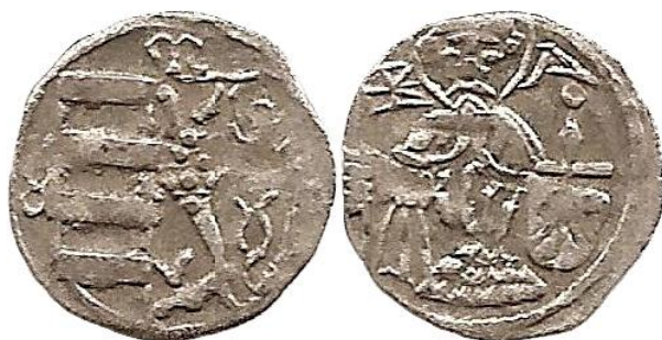
Il. 2. Halerz królewski Macieja Korwina b.d.; 10,5–10,8mm, 0,24 g. Kop. 8768; Fbg 1931, 116.

Cztery, takie same jak opisane powyżej odmiany halerzy Macieja Korwina, zostały również powtórzone w Ilustrowanym skorowidzu pieniędzy polskich i z Polską związanych Edmunda Kopickiego (dalej Kop.), odpowiednio w poz.: 8768–8771 – vide ilustracje nr 2–5.