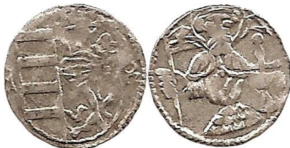
Il. 6. Halerz królewski Macieja Korwina b.d.; 10,2–10,4 mm, 0,23 g. Fbg –; Kop. –

Pierwsza z nich, to halerz królewski z postacią św. Wacława – vide ilustracja nr 6. W porównaniu z przedstawioną powyżej na ilustracji nr 2 odmianą notowaną przez Friedensburga (1931, poz. 116) oraz Kopickiego (poz. 8768), prezentowaną na ilustracji poniżej monetę wyróżnia odmienne wyobrażenie postaci na rewersie. Św. Wacław przedstawiony jest tu w „krótkim” płaszczu (krótkiej pelerynie?). Podobnie jak w przypadku halerza Fbg 1931, 116 / Kop. 8768, na awersie widnieje dwupółowa tarcza ze starym herbem Węgier i herbem Czech oraz gotyckie litery M (athias) A (ohemie) R (ex), odpowiednio górą i po bokach, a postać Wacława na rewersie przedstawiona jest z proporcem oraz mieczem i tarczą.