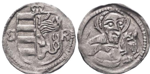
Il. 3. Halerz królewski Macieja Korwina b.d. 10 Kop. 8769; Fbg 1931, 122.