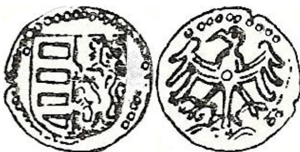
Il. 4. Halerz miejski Macieja Korwina b.d. Kop. 8770; Fbg 1931, 118.