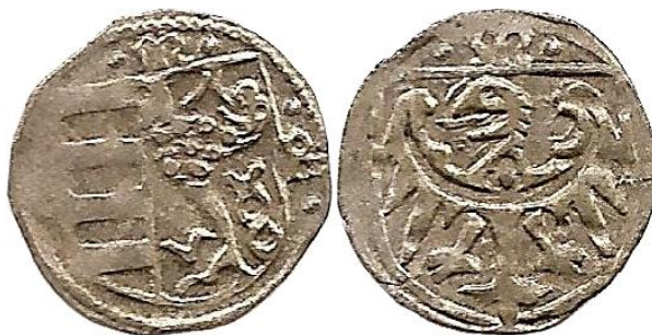
Il. 5. Halerz królewski Macieja Korwina b.d.; 11–11,6 mm, 0,18 g. Kop. 8771; Fbg 1931, 117

Przeprowadzona przez autorów szczegółowa analiza ikonografii stempli menniczych halerzy Macieja Korwina pozwoliła na wyodrębnienie dwóch nowych, nienotowanych dotychczas odmian.