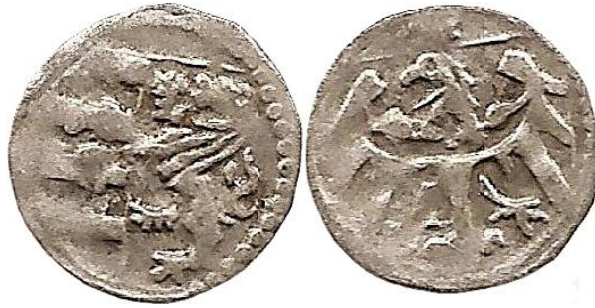
Il. 7. Halerz miejski Macieja Korwina b.d.; 10,5–11 mm, 0,23 g. Fbg –; Kop. –

Zapewne nie można jednoznacznie wykluczyć, że wprowadzona przez Friedensburga w katalogu Die schlesischen Münzen des Mittelalters odmiana opisana pod poz. 118 oraz powtórzona w Ilustrowanym skorowidzu pieniędzy polskich i z Polską związanych Kopickiego pod poz. 8770, to typ monety opisanej i zilustrowanej powyżej. Fakt, iż w tych wcześniejszych opracowaniach widnieje na rysunku rewersu orzeł bez tarczy i litery Ω nad nią, mógł być spowodowany tym, że Friedensburg dysponował bardzo słabo czytelnym egzemplarzem lub tylko niedokładną informacją o takiej odmianie.